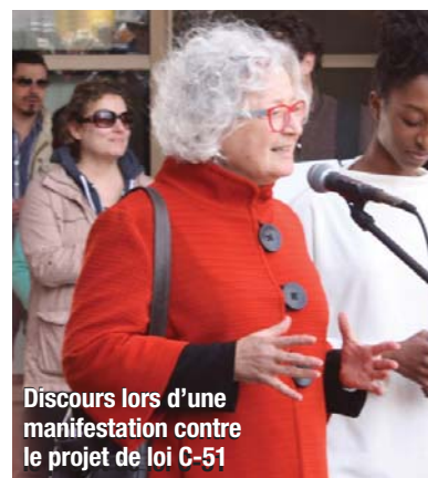
Discours lors d'une manifestation contre le projet de loi C-51

Je me suis exprimée lors du débat d'urgence sur le conflit en Ukraine. À cette occasion, j'ai fait l'éloge de la communauté ukrainienne du Canada et de ses initiatives de défense et de soutien, et j'ai souligné l'aide accrue offerte par le Canada pour régler le conflit de façon pacifique et les efforts de la société civile pour renforcer la primauté du droit et la gouvernance démocratique.