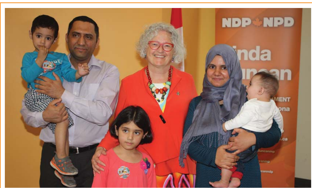
En mai, j'ai organisé une réception pour les nouveaux Canadiens vivant à Edmonton-Strathcona et j'ai été heureuse de rencontrer autant de personnes originaires de partout dans le monde et qui ont choisi de faire du Canada, et de Strathcona, leur nouveau foyer.

Comme bon nombre d'entre vous, j'ai été touchée et très impressionnée par le travail de la Commission de vérité et de réconciliation