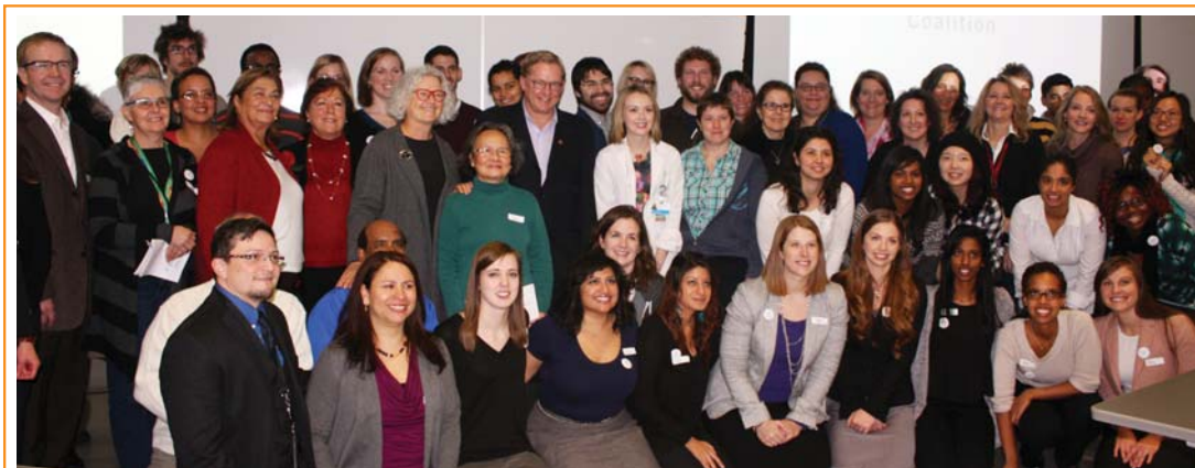
En compagnie des membres de l'Alberta Refugee Care Coalition lors du lancement de leur rapport « Filling the Gaps ». Composé de nombreux médecins, étudiants en médecine, médecins résidents et autres professionnels de la santé d'Edmonton, ce groupe s'est dit extrêmement préoccupé par les répercussions des compressions fédérales dans les services de santé essentiels pour les réfugiés et les demandeurs d'asile, et milite pour le rétablissement de ces services. Pour en savoir plus sur cette organisation, consultez le www.ARCHealth.com (en anglais).

L'Accord sur les soins de santé vient à échéance en 2014. Pourtant, même si les Albertains et la plupart des Canadiens considèrent toujours les soins de santé comme leur priorité absolue, le gouvernement conservateur s'entête dans son refus de rencontrer ses partenaires provinciaux et territoriaux. Aucun engagement n'a été pris pour un nouvel accord assorti de cibles contraignantes. Aucune mesure fédérale n'a été prise quant à une stratégie nationale sur les produits pharmaceutiques (un objectif énoncé dans l'Accord sur les soins de santé de 2004), et ce, malgré les efforts de collaboration déployés par certaines provinces en vue de fournir un accès à des médicaments sur ordonnance plus abordables. Une ordonnance sur dix n'est pas remplie parce que certains patients n'ont pas suffisamment