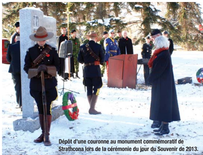
Dépôt d'une couronne au monument commémoratif de Strathcona lors de la cérémonie du jour du Souvenir de 2013.

L'information sur la Sécurité de la vieillesse et le Supplément de revenu garanti www.servicecanada.gc.ca/fra/services/pensions/sv/index.shtml .